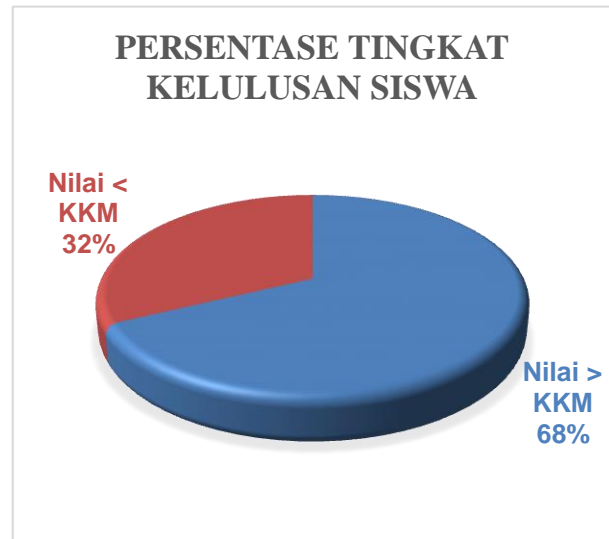
Gambar 4.2 Persentase tingkat kelulusan siswa pada Kelas Eksperimen Berdasarkan Kriteria Ketuntasan Minimal (KKM)

Kemampuan menulis puisi siswa menggunakan metode Nature Learning (kelas eksperimen) menunjukkan rata-rata nilai di atas nilai KKM yang telah ditetapkan. Hal ini dapat dilihat dari nilai rata-rata sebesar 80,24 berada di atas nilai KKM Bahasa Indonesia sebesar 75. Jika mengacu kepada standar kategori yang lazim digunakan, nilai rata-rata tersebut berada pada interval 70 hingga 100 yang artinya berada pada rentang tinggi . Artinya tingkat kemampuan menulis puisi siswa kelas XSMA Al Azhar 3 Bandar Lampung berada pada kategori tinggi. Berdasarkan sebaran nilai pada siswa kelas eksperimen yang disajikan pada Lampiran 2 dari 28 siswa, 9 siswa memperoleh nilai dibawah standar KKM, dan 19 siswa memperoleh nilai lebih dari standar KKM. Persentase tersebut disajikan pada Gambar 4.2.