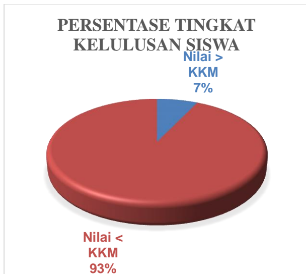
Gambar 4.2 Persentase tingkat kelulusan siswa pada Kelas Kontrol Berdasarkan Kriteria Ketuntasan Minimal (KKM)

Kemampuan menulis puisi siswa yang diajarkan dengan metode Konvensional menunjukkan rata-rata nilai di bawah nilai KKM yang telah ditetapkan. Hal ini dapat dilihat dari nilai rata-rata sebesar 60,24 berada di bawah nilai KKM Bahasa Indonesia sebesar 75. Artinya tingkat kemampuan menulis puisi siswa kelas X SMA Al Azhar 3 Bandar Lampung pada kelas kontrol masih kurang baik. Berdasarkan sebaran nilai pada siswa kelas kontrol yang disajikan pada Lampiran 2 dari 28 siswa, 26 siswa memperoleh nilai dibawah standar KKM, dan 2 siswa memperoleh nilai di atas KKM. Persentase tersebut disajikan pada Gambar 4.3.