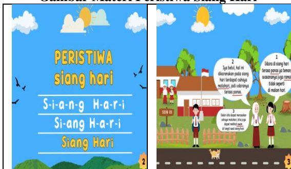
Gambar Materi Peristiwa Siang Hari