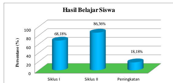
Gambar 4.3 Diagram Hasil Belajar Siswa Pada Siklus I dan Siklus II

Seluruh hasil yang diperoleh dari hasil belajar siswa pada siklus I dan siklus II beserta dengan peningkatannya dapat digambarkan pada diagram dibawah ini.